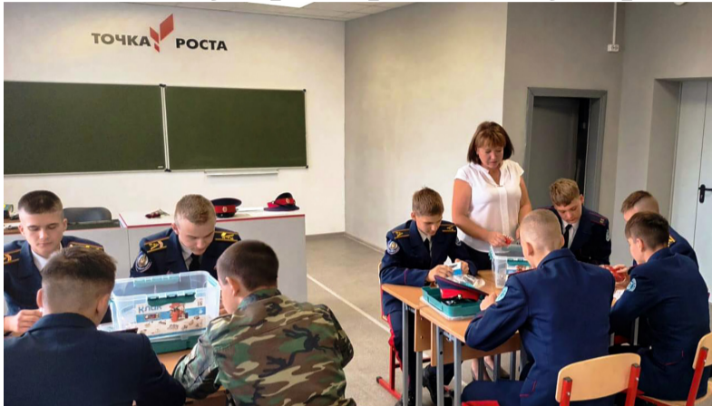
ГКОУ «Алексеевский казачий кадетский корпус имени Героя Российской Федерации генерал-полковника Г.Н.Трошева».

В Алексеевском районе в День Знаний начали работу еще три современных центра «Точка роста»