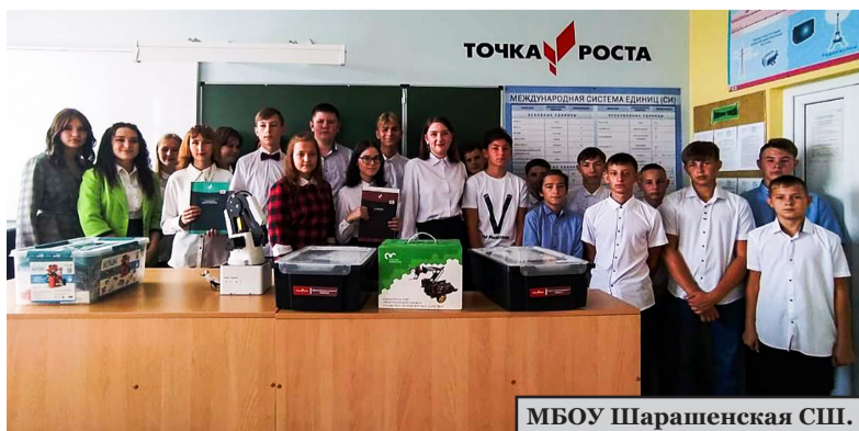
МБОУ Шарашенская СШ.