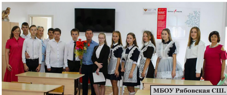
МБОУ Рябовская СШ.

Фото из архива МБОУ Рябовской СШ, МБОУ Шарашенской СШ и ГКОУ «Алексеевский казачий кадетский корпус имени Героя Российской Федерации генерал-полковника Г.Н.Трошева».