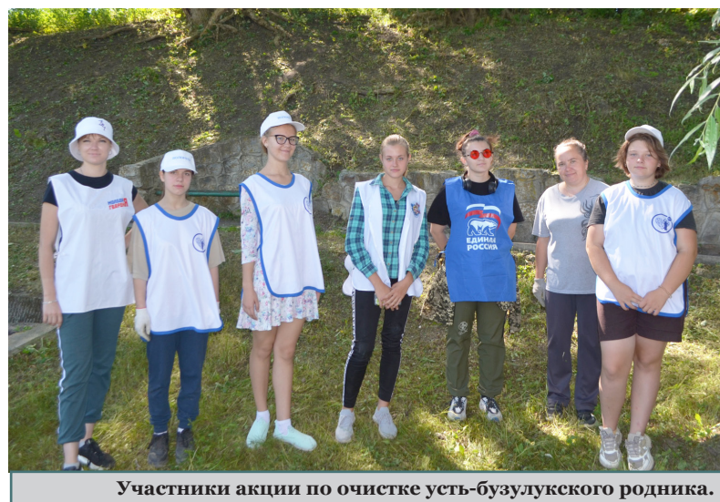
Участники акции по очистке усть-бузулукского родника.

Так называлась экологическая акция, в которой приняли участие усть-бузулукские волонтеры