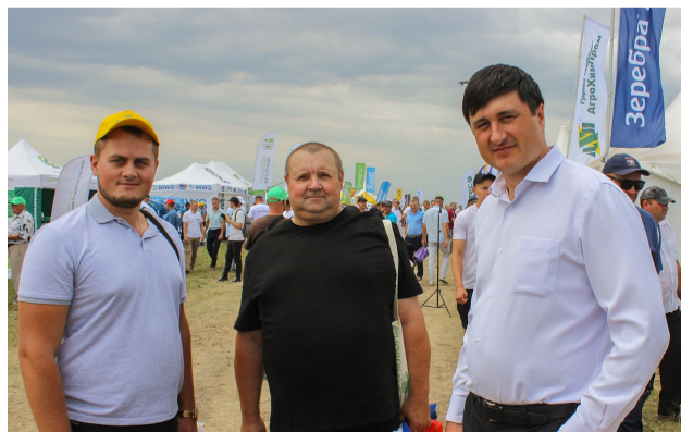
Представители Алексеевского муниципального района на ярмарке.