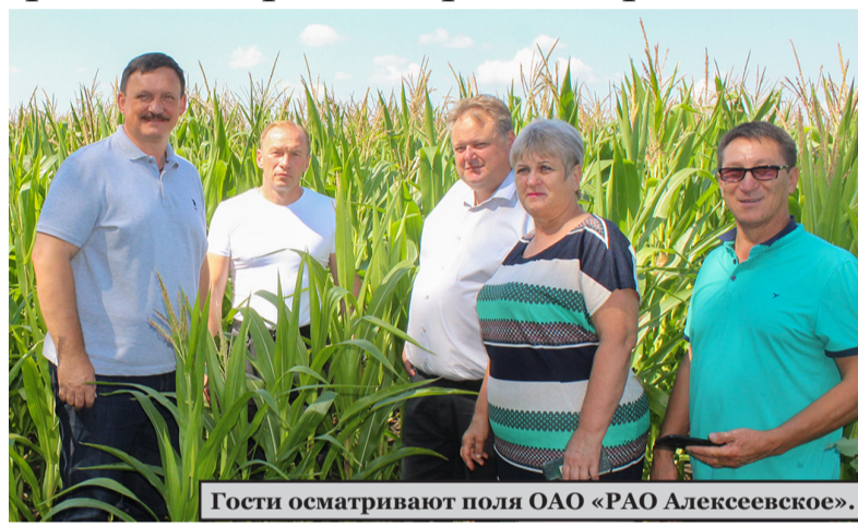
Гости осматривают поля ОАО «РАО Алексеевское».

Чтобы не быть голословными, хозяева провели небольшую экскурсию по здепшим полям. Надо сказать, что