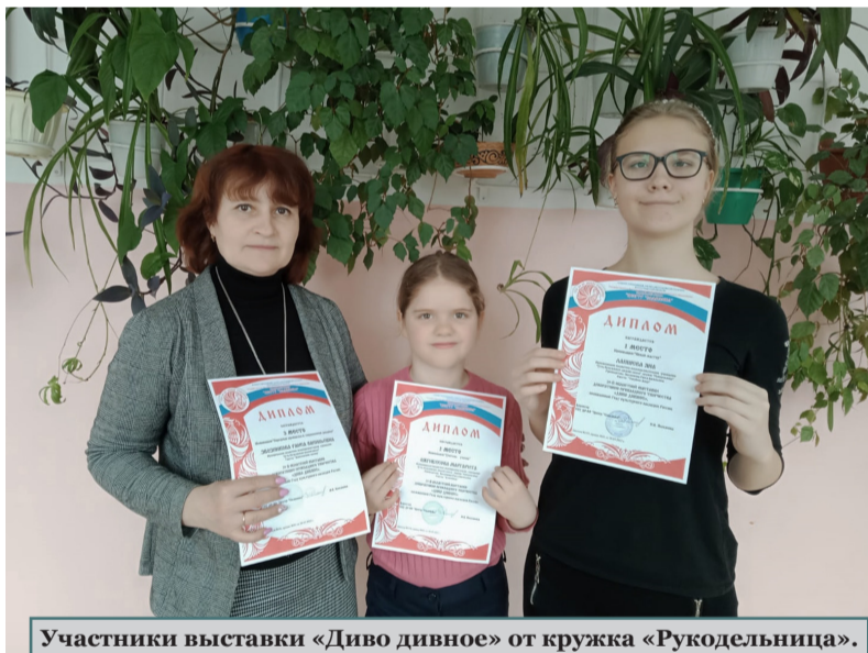
Участники выставки «Диво дивное» от кружка «Рукодельница».