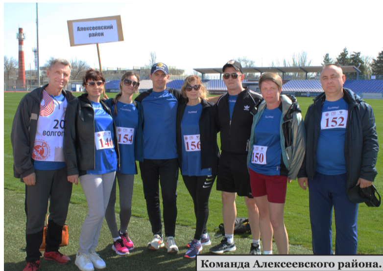
Команда Алексеевского района.

Также состоялись состязания по VI-IX ступеням ГТО, любители-физкультурники продемонстрировали свои возможности в сгибании и разгибании рук в упоре лежа на полу, накло-