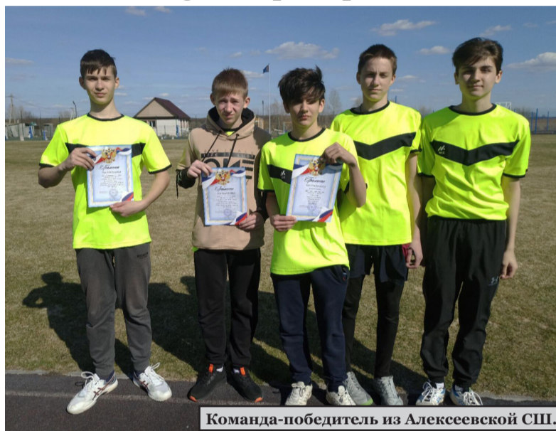
Команда-победитель из Алексеевской СШ.

«Шиповка юных» - соревнования, представляющие собой легкоатлетическое четырехборье. Дети соревновались в беге на 60 м, и на длинной дистанции - 600 м среди девушек и 1000 м среди юношей, в прыжках в длину с места и метании мяча. В соревнованиях среди девушек приняло участие шесть команд, среди юношей - девять из восьми школ района. В составе каждой команды было по пять человек, соревнования проводились раздельно среди юношей и среди девушек.