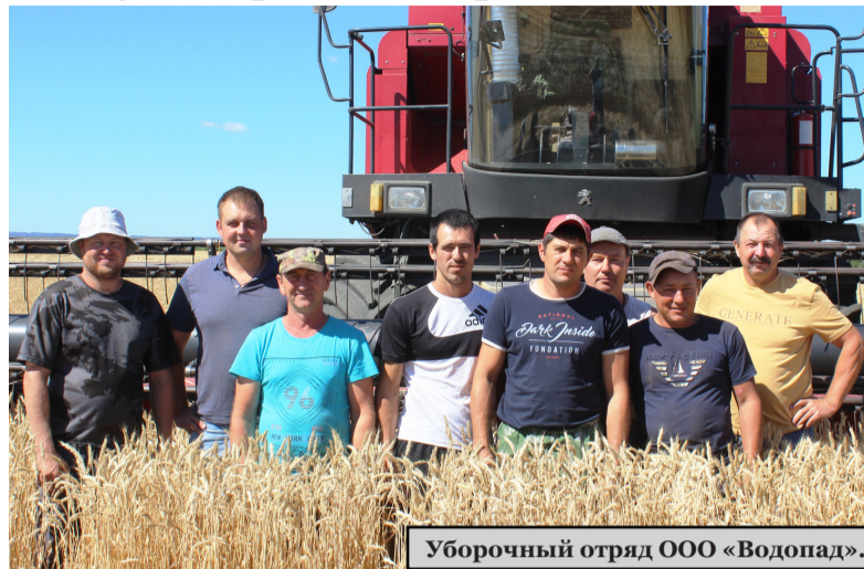
Уборочный отряд ООО «Водопад».