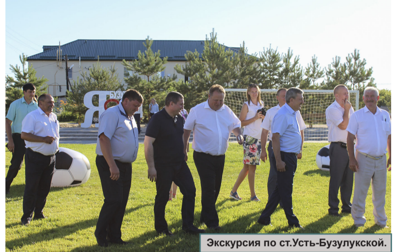
Экскурсия по ст.Усть-Бузулукской.