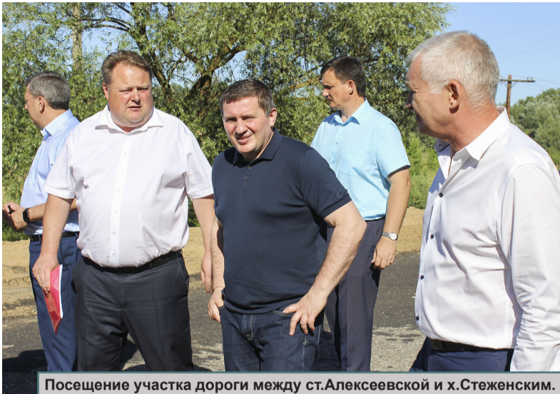
Посещение участка дороги между ст.Алексеевской и х.Стеженским.

Андрей Бочаров также проинспектировал результаты реализации проектов благоустройства станицы Усть-Бузулукской. Глава региона осмотрел территорию станицы, обновленные в течение последних четырех лет. За это время в Усть-Бузулукской, где проживает две тысячи человек, проведена