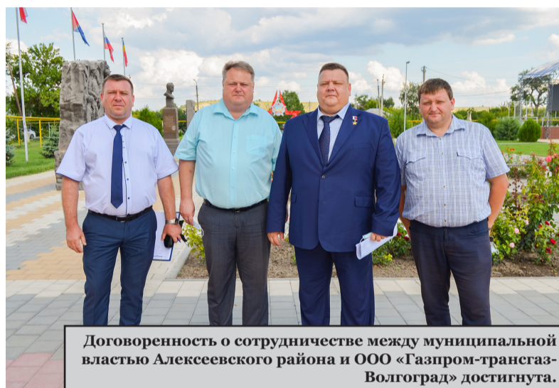
Договоренность о сотрудничестве между муниципальной властью Алексеевского района и ООО «Газпром-трансгаз-Волгоград» достигнута.

— Достигнуто многое. Существует и немало проблем. Работаем над решением поставленных задач, — завершая свое выступление, сказал глава района. — Есть главное: создана хорошая, работоспособная команда; налажено конструктивное сотрудничество с организациями и предприятиями, функционирующими на территории Алексеевского района; работает четкое и оперативное взаимодействие с