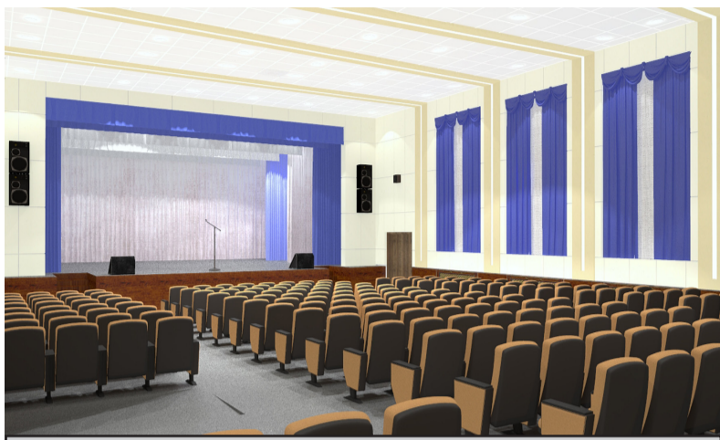
Так будет выглядеть обновленный главный зал Алексеевского РДК.

В Алексеевском районном доме культуры ведутся ремонтные работы