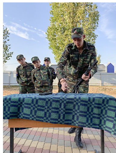
Игра-квест «Школа выживания» (архив).

Впереди у воспитанников казачьего кадетского корпуса имени Героя Российской Федерации генерал-полковника Г.Н. Трошева большой юбилей - двадцать лет. Со дня открытия корпуса, которое произошло 2-го декабря 2000 года, случилось немало интересного, но сколько еще всего предстоит сделать. Воспитатели с оптимизмом смотрят в будущее и уверены, что их ребята будут и дальше показывать себя и защищать честь нашего района. Пусть мы живем в современном мире, без войн и насилия, а казачество в этой связи уже не ассоциируется исключительно с войной, но здесь у ребят формируется характер и из них вырастают достойные и уверенные в себе личности. А подобные качества ценились во все времена.