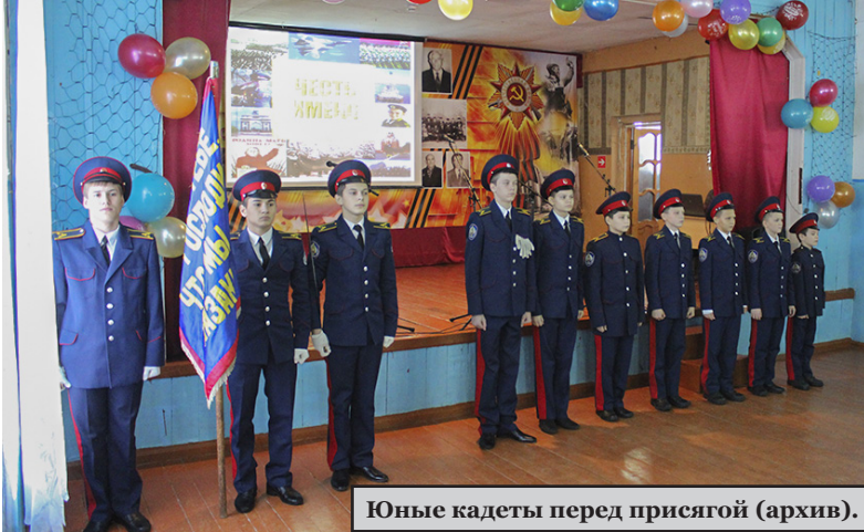
Юные кадеты перед присягой (архив).

Алексеевский казачий кадетский корпус имени Героя РФ генерал-полковника Г.Н.Трошева готовится отметить двадцатилетний юбилей