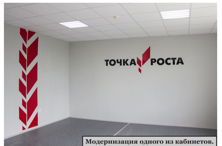
Модернизация одного из кабинетов.

В Яминской средней школе готовится к открытию современный образовательный центр