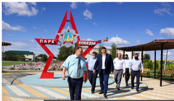
Гости знакомятся с парком 70-летия Победы в ст.Усть-Бузулукской.