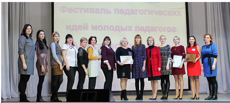
Передача символа эстафеты Алексеевскому району от Новониколаевского.

В ст. Алексеевской состоялась областная Фестиваль педагогических идей