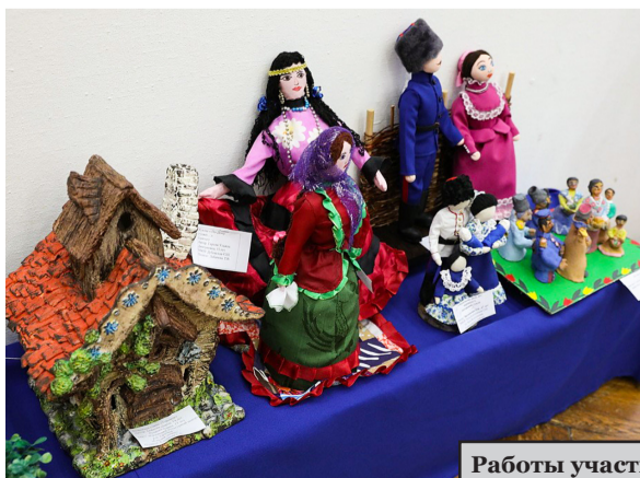
Работы участников конкурса.

Кристина ТАМАХИНА.