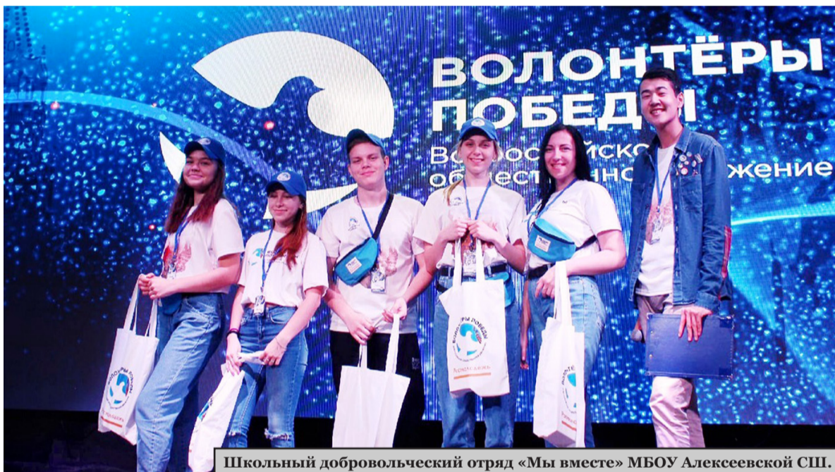
Школьный добровольческий отряд «Мы вместе» МБОУ Алексеевской СШ.

В Волгоградской области выбрали лучший школьный отряд Волонтеров Победы