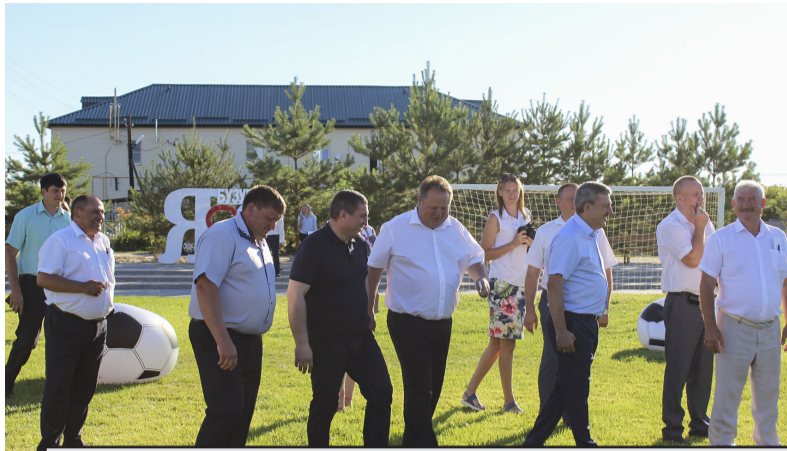
Губернатор региона А.И. Бочаров побывал в ст. Усть-Бузулукской и одобрил работу местной власти в вопросах благоустройства.

Впрочем, контроль ключевых проектов Бочаров всегда оставлял за собой. И вместо бумажных докладов и речей постоянно выезжал на объекты.