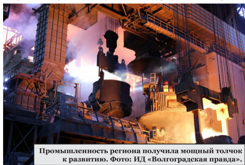
Промышленность региона получила мощный толчок к развитию.