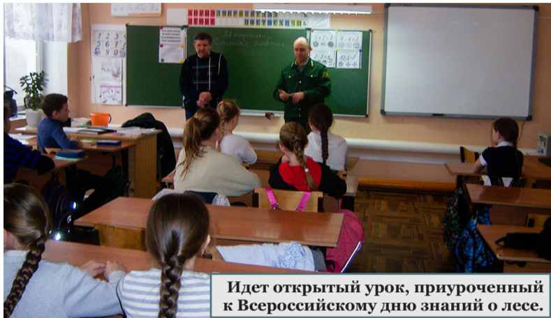
Идет открытый урок, приуроченный к Всероссийскому дню знаний о лесе.

Алексеевские школьники стали участниками Всероссийского дня знаний о лесе