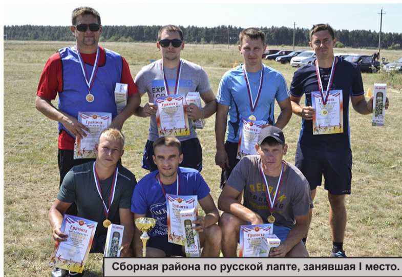
Сборная района по русской лапте, занявшая I место.

Состязание состоялось в рамках учебно-тренировочных сборов перед поездкой на зональные областные сельские спортивные игры в Кумылженский район, которые пройдут в конце августа.