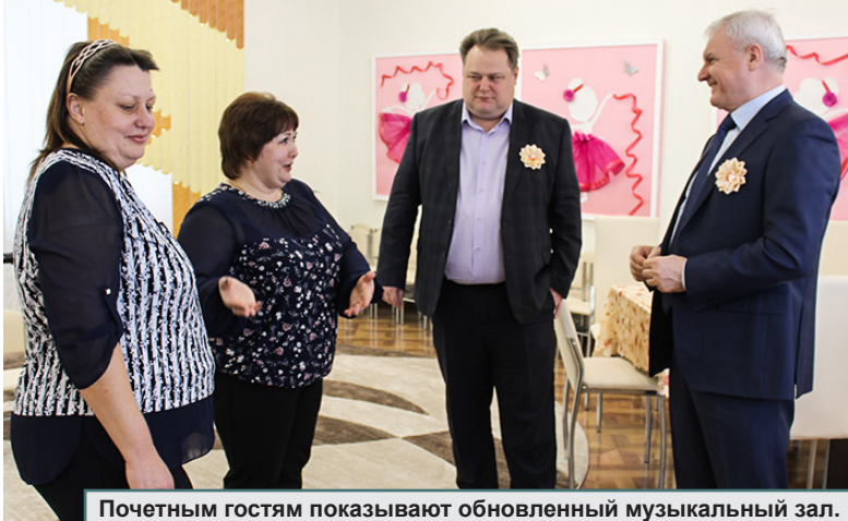
Почетным гостям показывают обновленный музыкальный зал.