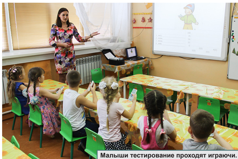
Малыши тестирование проходят игрушкой.

Алексеевцев по многим направлениям можно ставить в пример, - отметил депутат Плотников. - В благоустройстве своих территорий вам нет равных. На высоте инвестиционная политика. Об-