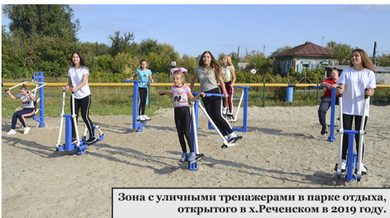
Зона с уличными тренажерами в парке отдыха, открытого в х.Реченском в 2019 году.

Современные площадки для сдачи нормативов ГТО по региональному приоритетному проекту «Спорт – норма жизни» нацпроекта «Демография» в 2019 году были созданы в 14 районах Волгоградской области. В 2020-2021 годах возведут еще 12 малых спортивных площадок со специальным оборудованием для тестирования нормативов ГТО. В