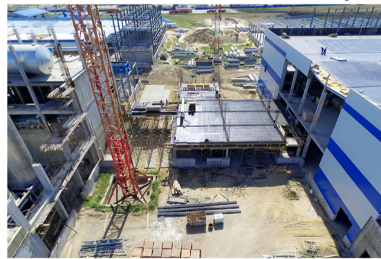
Переходная галерея. Лаборатория (корпус 33)

в жизнь 8 инвестиционных проектов в сфере АПК. Среди них, строительство зерноочистительного комплекса и механизированного тока ЗАВ-40 в ст.Усть-Бузулукской и реконструкция зерноочистительного комплекса в ст.Алексеевской (ОАО «РАО Алексеевское»), строительство зерноскладов в х.Самолшинском (ОАО «Самолшенское»), строительство механизированного тока в х.Скулябинском (ООО «Садко»), реконструкция зерносклада в ст.Аржановской (ООО «Водяновское»), строительство мастерской по ремонту сельхозтехники в х.Рябовском (ООО «Дальний»).