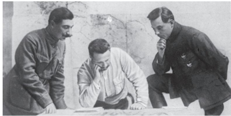
Три советских полководца (слева направо): Семен Буденный, Михаил Фрунзе и Климент Ворошилов.

События столетней давности оставили большой след в истории страны, однако некоторые ее страницы мало кто знает. Сотрудники мемориально-исторического музея «Сталинградская битва» рассказали об удивительных фактах нескольких военных лет, когда Царицын оказался в самом эпицентре борьбы за страну.