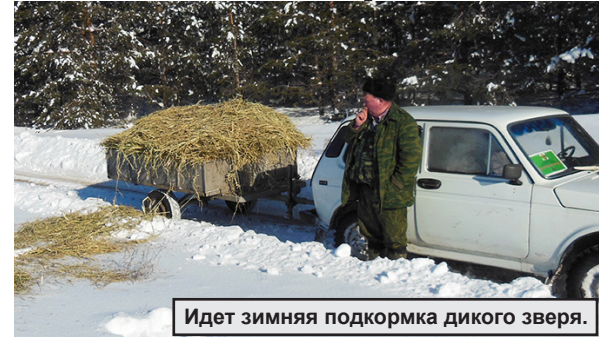
Идет зимняя подкормка дикого зверя.