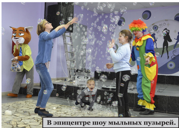
В эпицентре шоу мыльных пузырей.

В Алексеевском районе прошло детское мероприятие, приуроченное к Международному дню инвалидов