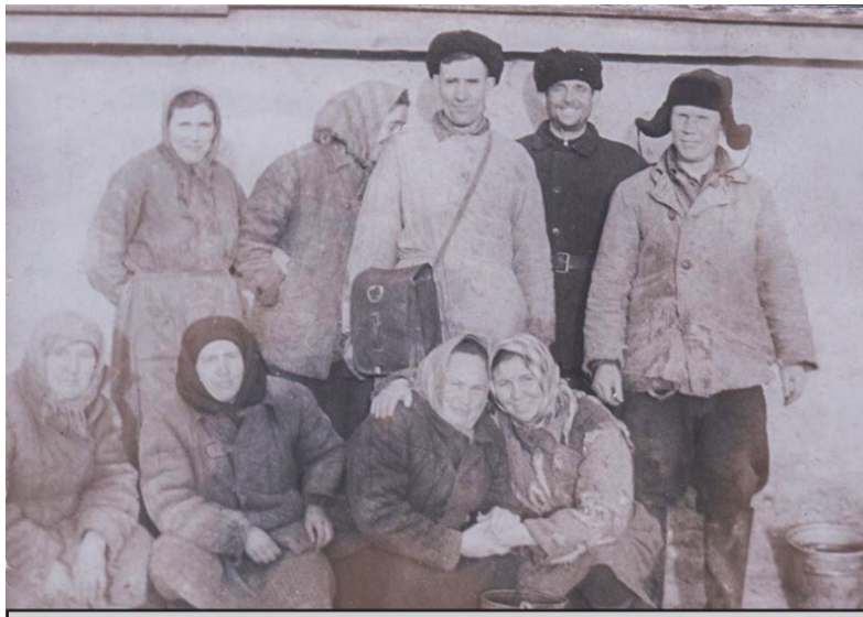
Рабочие СТФ отделения №4 совхоза «Дальний» (февраль 1960 г.).

«Наименование, количество Лошадей (всего) – 60,