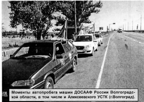
Моменты автопробега машин ДОСААФ России Волгоградской области, в том числе и Алексеевского УСТК (г.Волгоград).

Волгоградская область стала ключевым этапом всероссийского автопробега в честь 90-летия ДОСААФ России