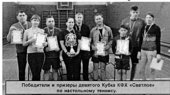
Победители и призеры девятого Кубка КФХ «Светлое» по настольному теннису.

Есть и в хуторе Поклоновском неравнодушные люди, которые оказывают финансовую поддержку в проведении спортивных мероприятий. Ежегодно в марте на