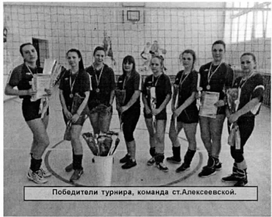
Победители турнира, команда ст.Алексеевской.

Помимо грамот, медалей и денежных призов, победителям, призерам и лучшим игрокам, а также всем участницам и болельщицам были вручены цветы.