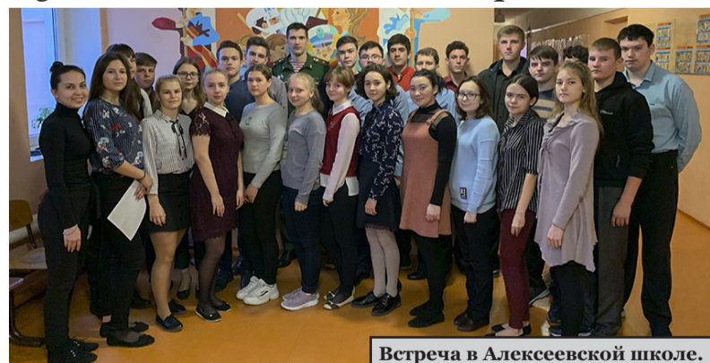
Встреча в Алексеевской школе.

Встречи прошли в Алексеевской, Усть-Бузулукской и Реченской средних школах, а также в ГКОУ «Алексеевский