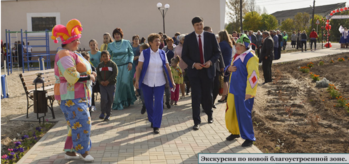
Экскурсия по новой благоустроенной зоне.

В х.Реченском в рамках празднования Дня хутора была открыта благоустроенная зона отдыха и развлечений