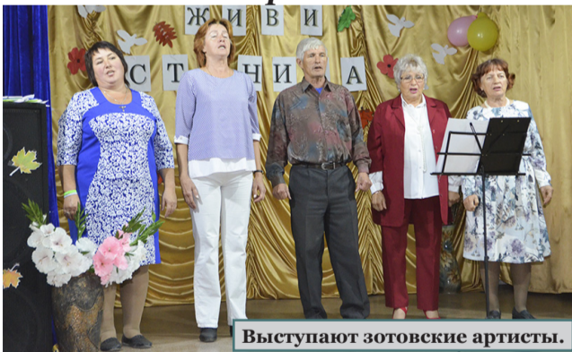
Выступают зотовские артисты.

Жители станицы Зотовской радушно и хлебосольно встретили именины своей малой родины