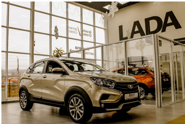
На правах рекламы.

Ждем Вас каждый день с 09 до 21:00: Форвард-Авто LADA - г. Волгоград, Арсеньева, 1Г. (8442) 700 005