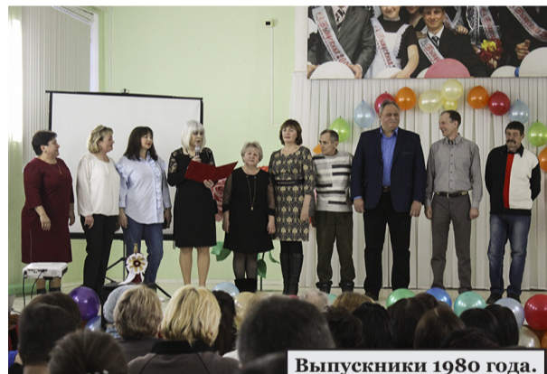
Выпускники 1980 года.