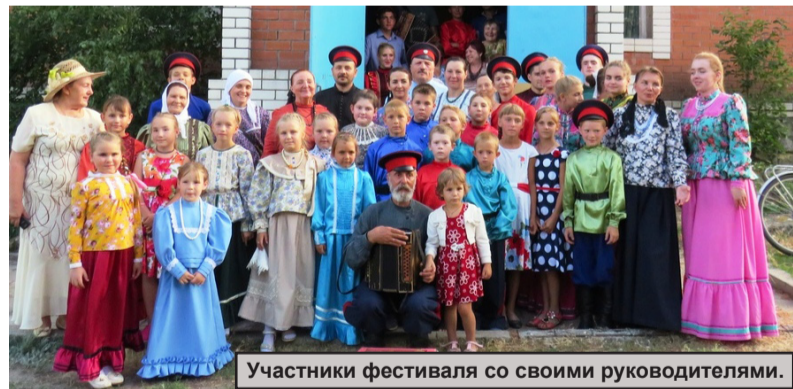
Участники фестиваля со своими руководителями.

В х.Дурновском Новоаннинского района состоялась межрайонный детский фольклорный фестиваль, посвященный 75-летию Сталинградской битвы