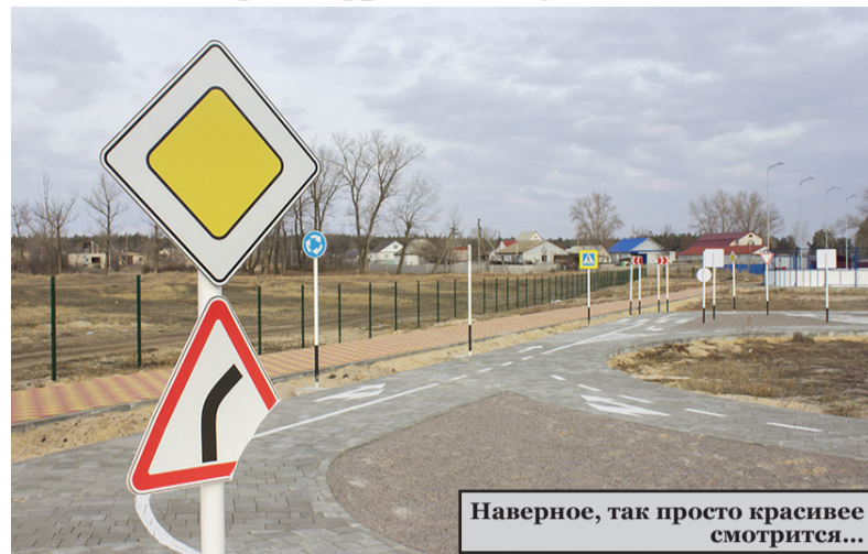
Наверное, так просто красивее смотрится...

К сожалению, старая пословица не теряет актуальности даже в современном, культурном обществе