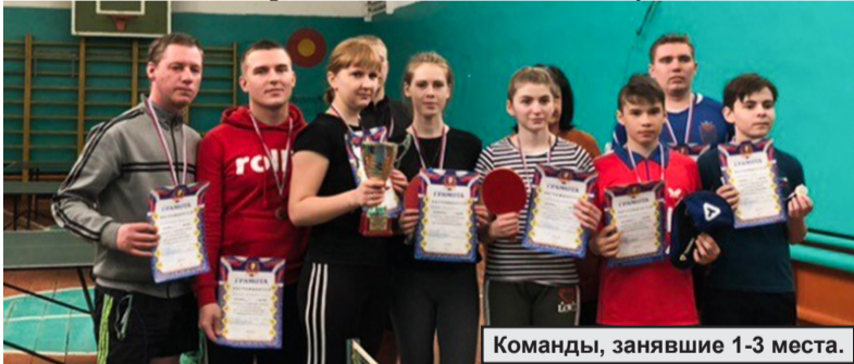
Команды, занявшие 1-3 места.