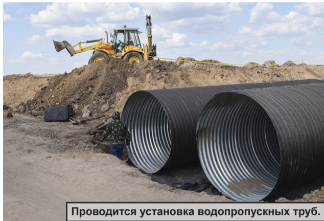
Проводится установка водопропускных труб.