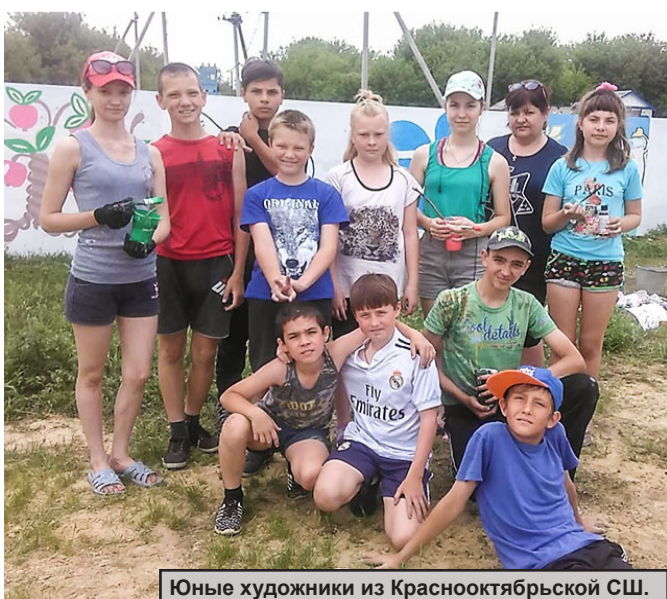
Юные художники из Краснооктябрьской СШ.

Наталья ГОЛУБЕВА.