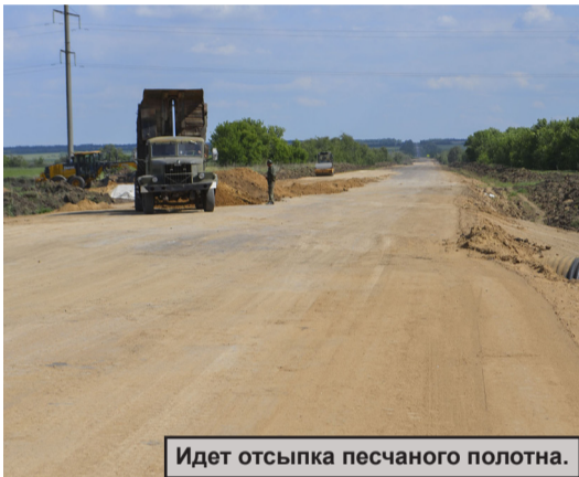
Идет отсыпка песчаного полотна.