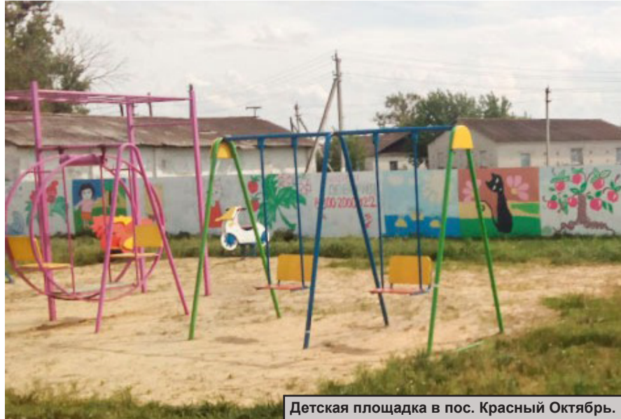
Детская площадка в пос. Красный Октябрь.