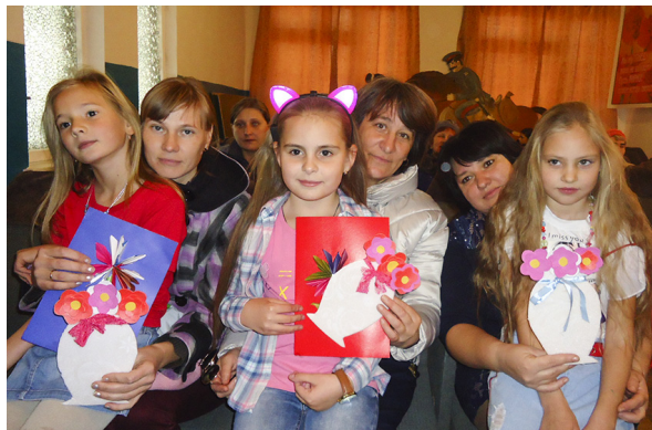
ных и дорогих мам, и очень важно приносить им как можно больше радости.

Этот прекрасный праздник - замечательный повод напомнить нашим детям, что нужно беречь своих люби-