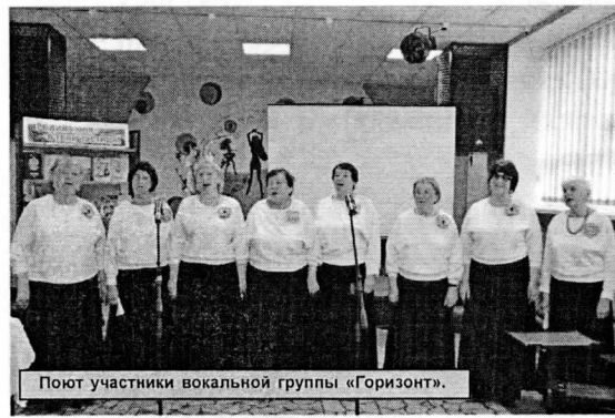
Поют участницы вокальной группы «Горизонт».