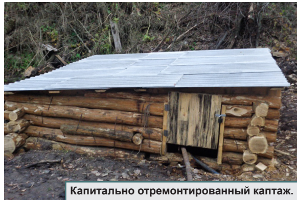
Капитально отремонтированный каптаж.