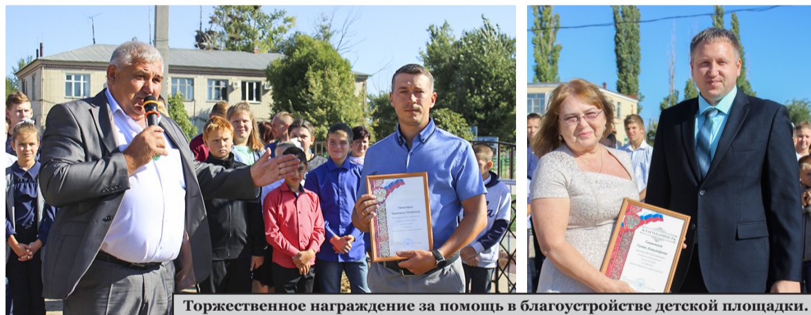
Торжественное награждение за помощь в благоустройстве детской площадки.