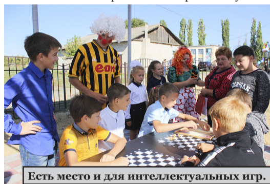
Есть место и для интеллектуальных игр.