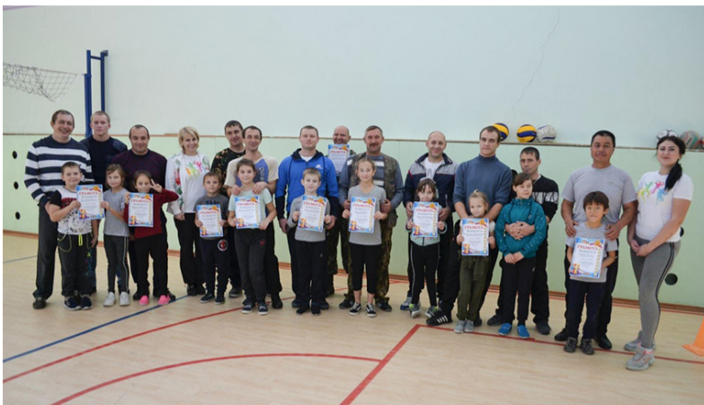
Участники и организаторы веселых стартов «Вместе с папой».

На старт вышли три команды: «Молния», «Туча» и «Маквин», в каждой по 8 человек (4 пары - папа и ребенок). Программа «Веселых стартов» была довольно насыщенной. Командам предложили занимательные, иногда очень непростые конкурсы с бегом, прыжками с мячом. В состязаниях как дети, так и взрослые смогли проявить свои спортивные навыки. Все этапы этих увлекательных сорев-