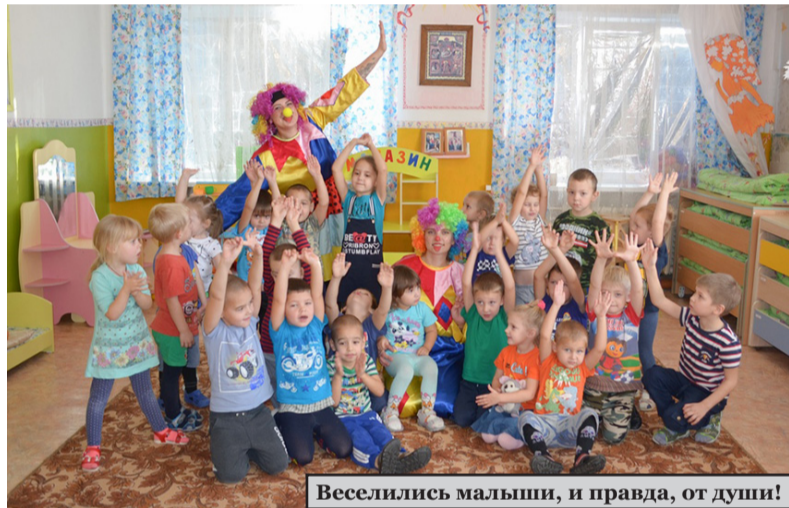
Веселились малыши, и правда, от души!

Екатерина ЧУМАКОВА, заместитель директора МБУ «Молодежный центр».