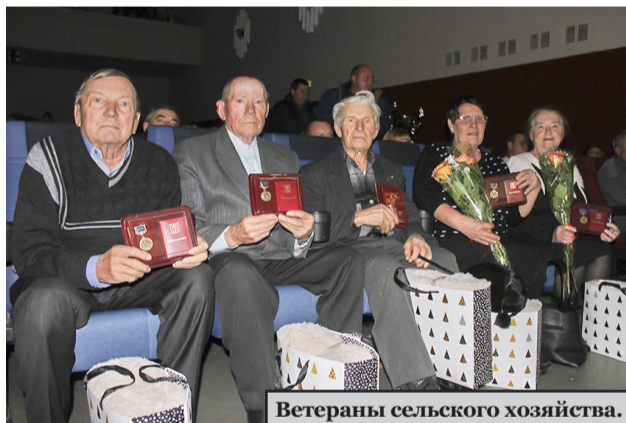
Ветераны сельского хозяйства.