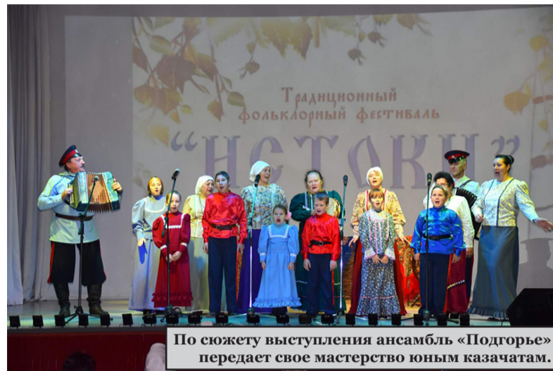
По сюжету выступления ансамбль «Подгорье» передает свое мастерство юным казачатам.