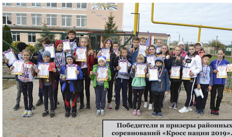
Победители и призеры районных соревнований «Кросс нации 2019».

В минувшую субботу, 12 октября, в районном центре прошел осенний кросс в рамках Всероссийского дня бега «Кросс нации 2019».