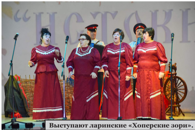
Выступают ларинские «Хоперские зори».