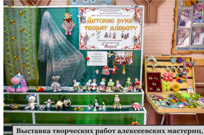
Выставка творческих работ Алексеевских мастериц.