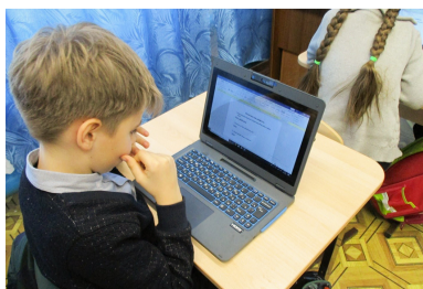
Второклассники выполняют задания.

Наши ученики уже принимают участие в онлайн-уроках финансовой грамотности, организованных Центральным банком Российской Федерации. В рамках Всероссийского проекта «Открытые уроки» участвовали в демонстрации шоу профессий «Большая стройка». Дети также имеют возможность смотреть уроки из других школ, получая таким образом знания от лучших педагогов страны.