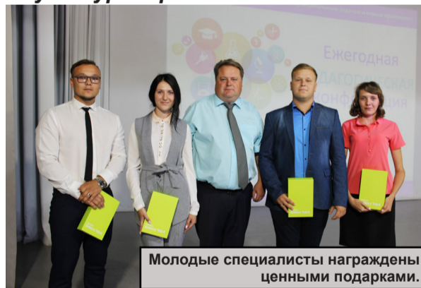
Молодые специалисты награждены ценными подарками.

Перед собравшимися также выступила и.о. начальника отдела образования администрации Алексеевского муниципального района