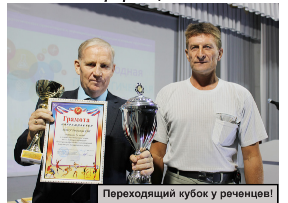
Переходящий кубок у реченцев!

реализация программы психолого-педагогической, методической и консультативной помощи родителям детей, получающих дошкольное образование в семье; создание современной и безопасной цифровой образовательной среды, обеспечивающей высокое качество и доступность образования всех видов и уровней; внедрение национальной системы профессионального роста педагогических работников, охватывающей не менее 50 процентов учителей общеобразовательных организаций и ряд других не менее важных задач. Главное то, что муниципальная система образования сохраняет основные параметры и динамично развивается, обеспечивая конституционные права граждан на образование, вариативность образовательных программ, возможность внеурочной занятости несовер-