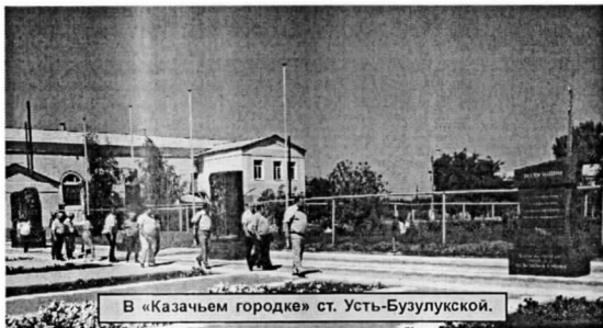
В «Казачьем городке» ст. Усть-Бузулукской.

Анна ЗАХАРОВА.