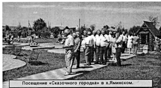
Посещение «Сказочного городка» в х.Яминском.

— Я частый гость Алексеевского района. Безусловно, благоустройство у вас на высшем уровне. Вспоминая станицу той, которая была ранее,