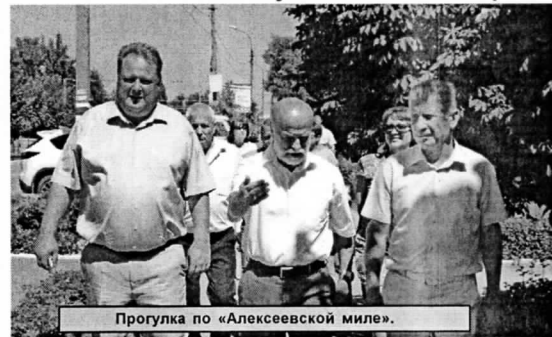
Прогулка по «Алексеевской миле».

На минувшей неделе наш район посетили гости из Новоаннинского муниципального района