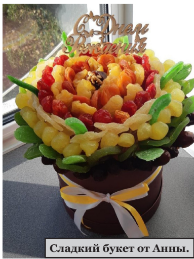
Сладкий букет от Анны.

Наталья ЛОКТИОНОВА.