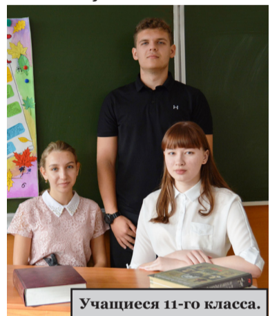
Учащиеся 11-го класса.