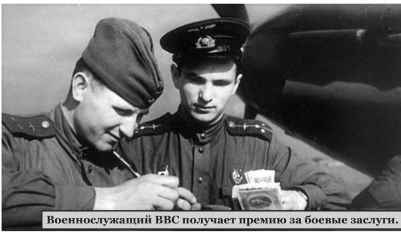
Военнослужащий ВВС получает премию за боевые заслуги.

Особо отличившихся военнослужащих представляли к награждению орденами и медалями СССР. Орденосцы получали ежемесячные денежные выплаты. Например, Герою Советского Союза - 50 рублей, кавалеру ордена Ленина - 25 рублей, Красного Знамени - 20 рублей и Красной Звезды - 15 рублей.