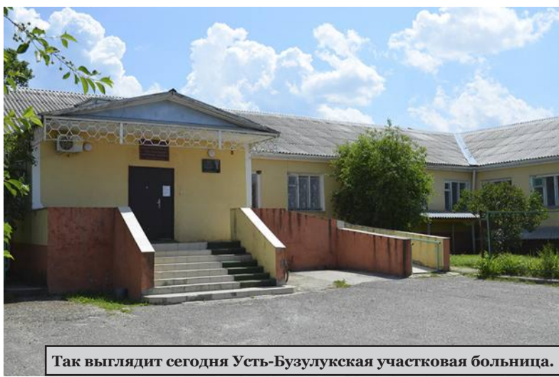
Так выглядит сегодня Усть-Бузулукская участковая больница.

Материал подготовлен Наталией ГОЛУБЕВОЙ при активном участии медсестры Усть-Бузулукской больницы Н.А.Куропятниковой.