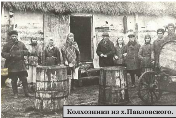
Колхозники из х.Павловского.

22 июня «Большевицкое знамя» еще давала информацию о мирных делах Алексеевцев, а война уже вторглась в жизнь людей. В полдень по радио с заявлением Советского правительства выступил заместитель председателя Совнаркома СССР и нарком иностранных дел В.М. Молотов. В заявлении выражалась твердая уверенность в победе над вероломным агрессором: «Наше дело правое, враг будет разбит. Победа будет за нами». Резко изменился характер публикуемых в районной газете ма-