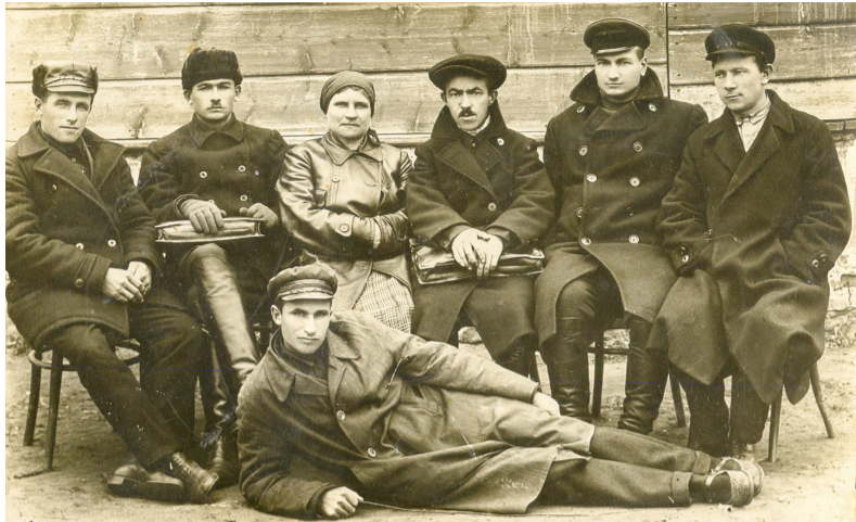
Организационная комиссия коммуны «Большевик», 1929 г.

Станица Алексеевская – одно из старейших поселений Области Войска Донского. Первое упоминание о ней относится к 1700 году. До 1858 года станица была центром Хоперского округа Области Войска Донского Российской империи. По состоянию на 1918 год Алексеевская являлась станицей Алексеевского юрта Хоперского округа. В юрт входило 19 хуторов.