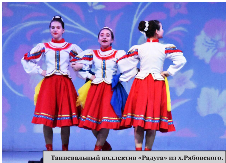
Танцевальный коллектив «Радуга» из х.Рябовского.

В Алексеевском районе прошел традиционный фестиваль творческой молодежи