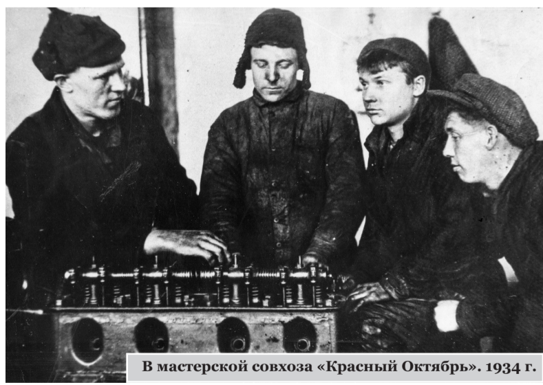
В мастерской совхоза «Красный Октябрь». 1934 г.