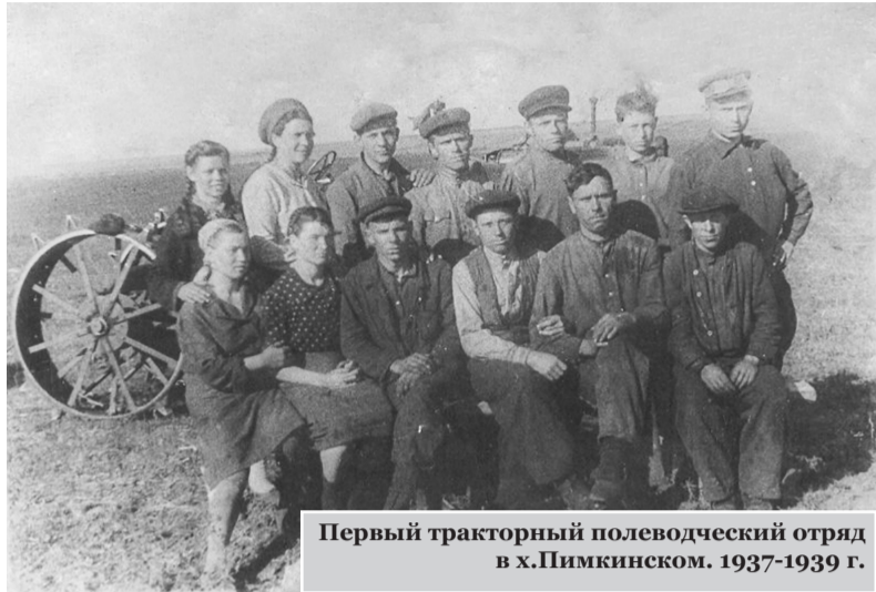
Первый тракторный полеводческий отряд в х.Пимкинском. 1937-1939 г.

Вот что там говорится об Алексеевском районе: «Алексеевский район реорганизован в 1935 году при разукрупнении Алексеевского и Кумылженского районов. В состав района входят 106 населенных пунктов с общим населением 21260 человек. Район объединяет 21 сельсовет (Алексеевский, Бабинский, Березовский, Гришинский, Захаровский, Исакиевский, Ларинский, Павлов-