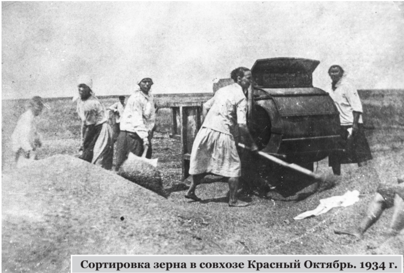
Сортировка зерна в совхозе Красный Октябрь. 1934 г.

При проведении коллективизации было допущено много перегибов, незаконного раскулачивания, в отдельных районах нарушения достигали больших масштабов. Среди населения было много недовольства, по всей стране возникали бунты, поджоги колхозного имущества, убийства колхозных активистов.