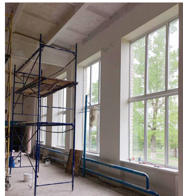
В рябовском школьном спортзале уже заменены окна, проведен ремонт стен и потолка.

В этом году дети завершили учебный год дистанционно, что позволило приступить к ремонту школьных спортзалов раньше запланированного срока, начав его уже весной. Работы предусматривают замену оконных блоков, дверных проемов, покраску стен и потолков, настил спортивного напольного покрытия. Также для школ приобретут новый спортивный инвентарь и оборудование. На базе каждого зала создадут клуб, в котором школьники в сво-