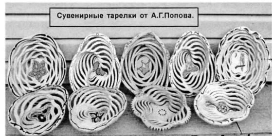
Сувенирные тарелки от А.Г.Попова.

– Я не делаю простые украшения, мне это не интересно, – признается А.Г. Попов. – Двух одинаковых наличников для разных домов я никогда не создам. Каждая рабо-