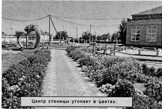
Центр станицы утопает в цветах.

Станица Усть-Бузулукская за последние годы не просто похорошела, а преобразилась до неузнаваемости