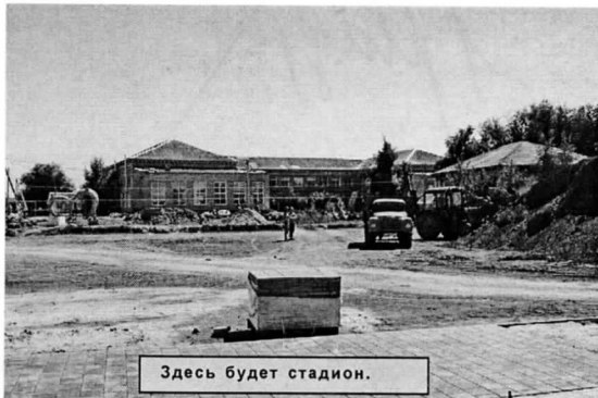
Здесь будет стадион.