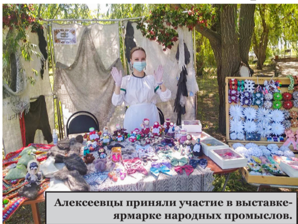
Алексеевцы приняли участие в выставке-ярмарке народных промыслов.

Уже десять лет фольклорный праздник «Троица на Бузулуке» считается одним из главных брендовых мероприятий Волгоградской области