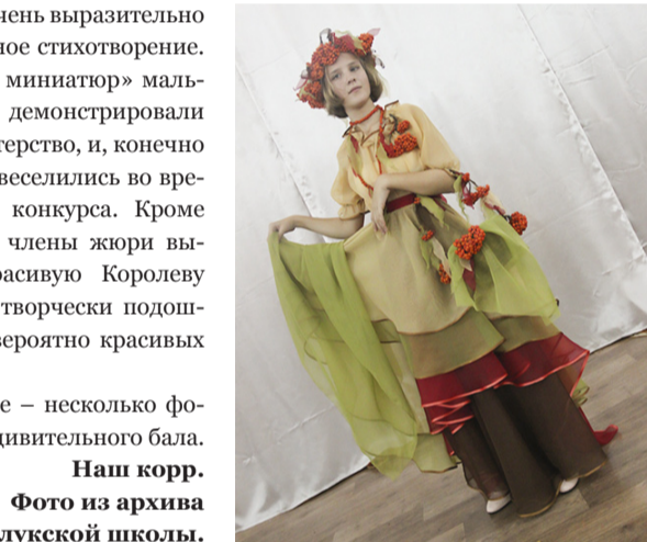
Наш корр.

И в завершение – несколько фотографий с этого удивительного бала.